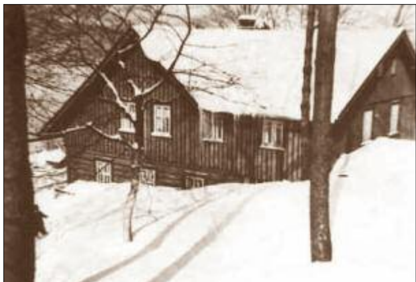
Fotografie z roku 1940