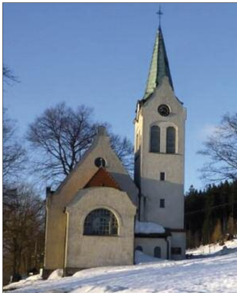
Evangelický kostel v Herlíkovicích - viz příloha str. 5 - 6