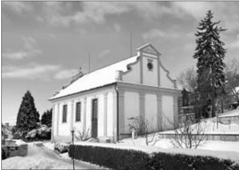
Areál evangelického sboru v Lysé nad Labem kulturní památkou (viz str. 4)