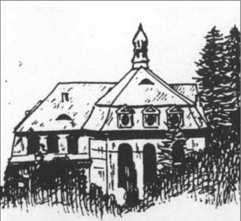
Kresba sborového domu v Železném Brodě