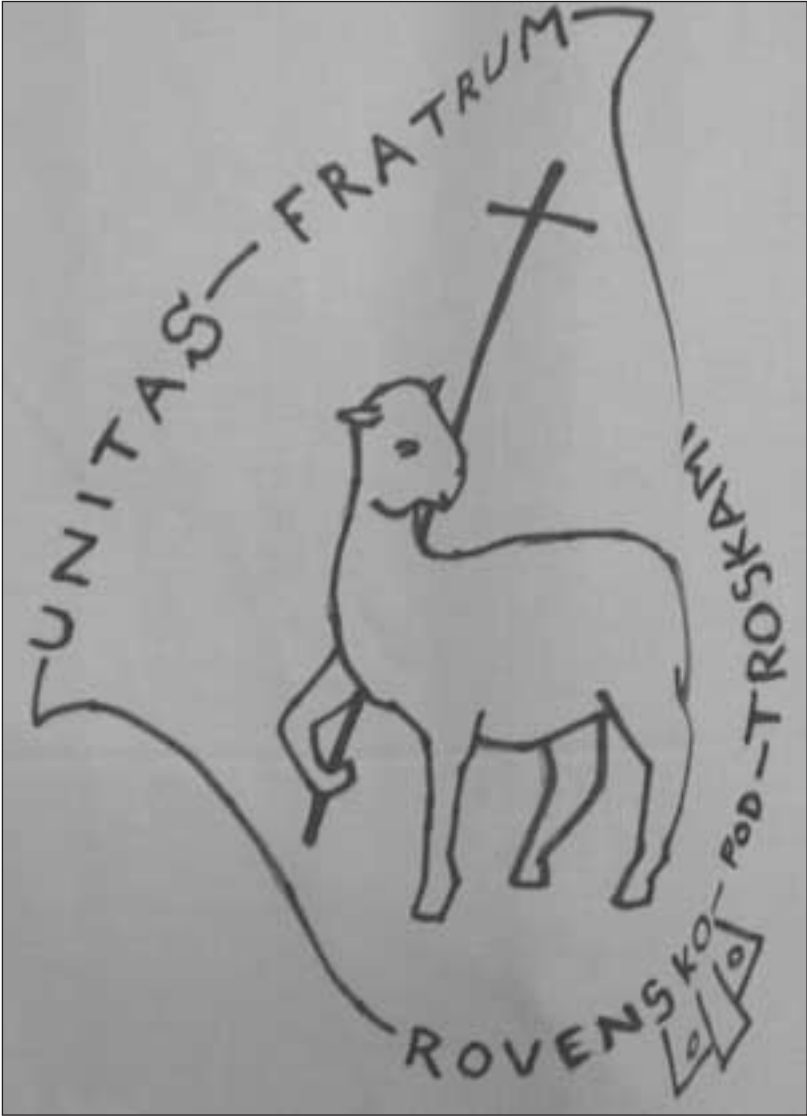
Plakátek, kterým se představoval sbor v Rovensku pod Troskami na setkání sborů z Čech a Německa