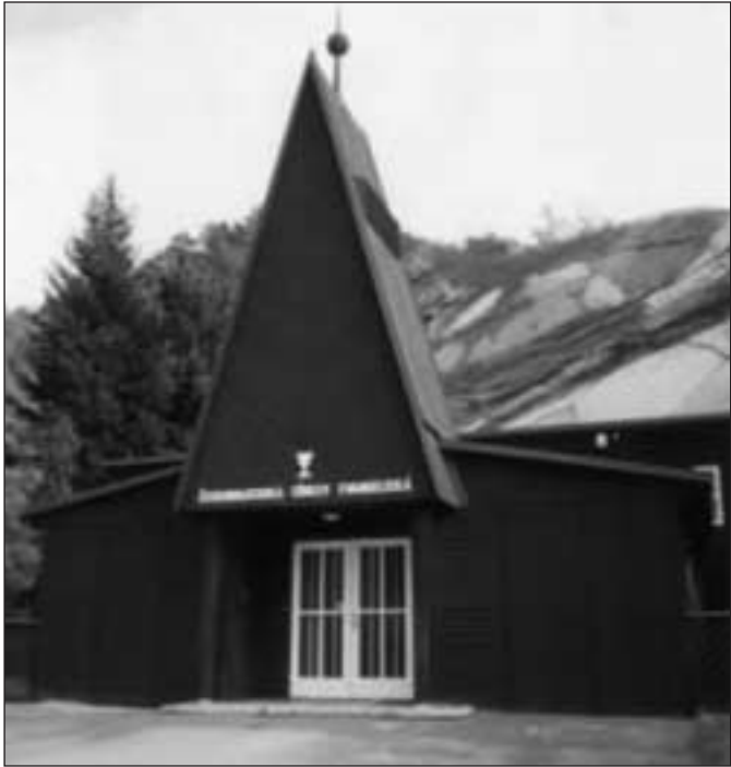
Kostel Českobratrské církve evangelické v Praze - Braníku

Kniha nechce jitřit, ale rozhodně chce varovat před zapomináním a podceňováním příčin všeho, co si člověk i v minulém století musel vystát. Upomíná nás na duchovní lhostejnost a nedbalost, do které život svou náročností člověka strhává. Ať v minulosti nebo dnes.