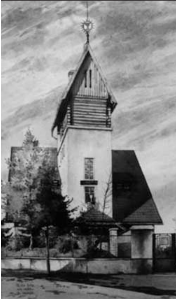
Kostel Českobratrské církve evangelické v Merklíně