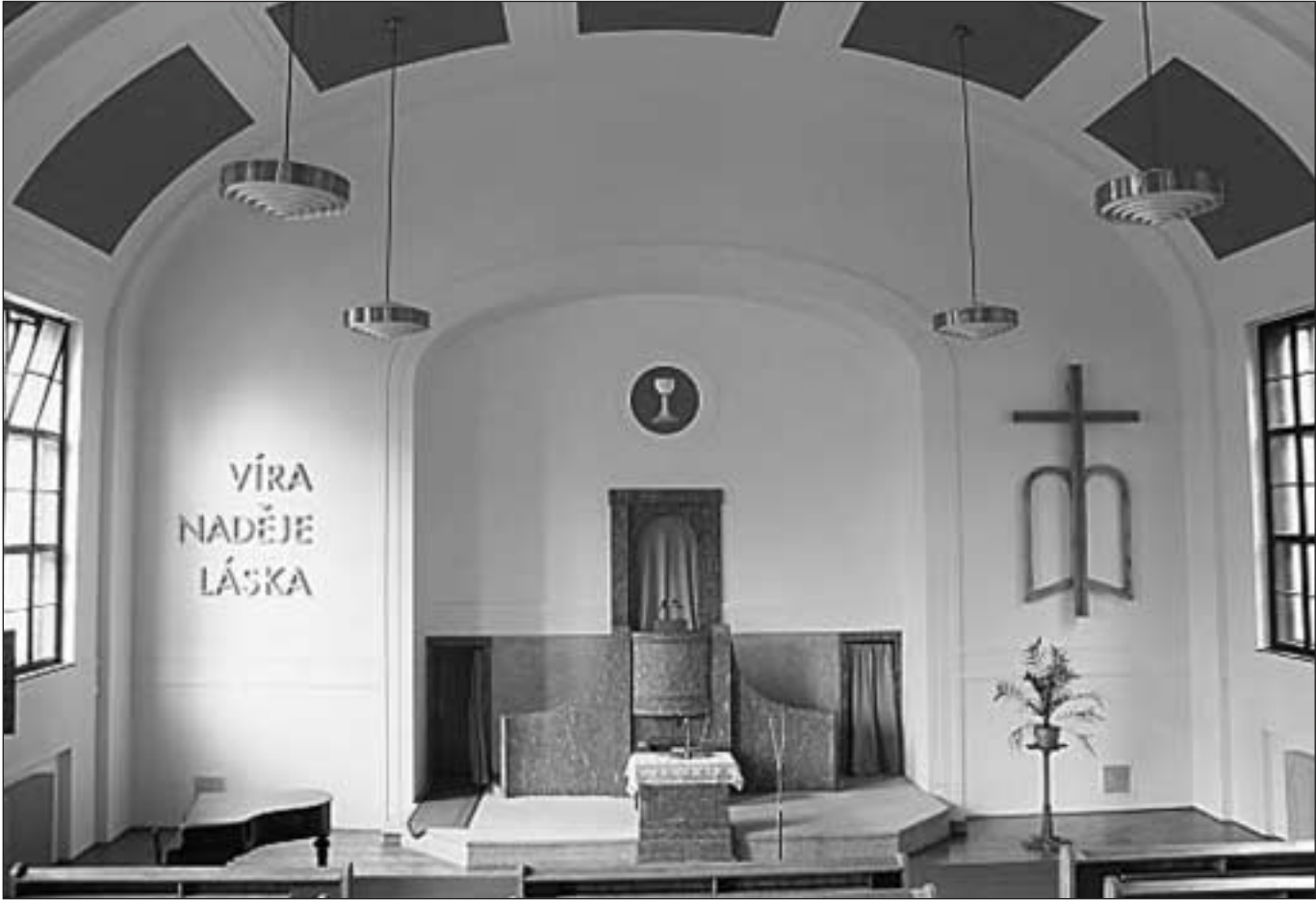
Interiér kostela Českobratrské církve evangelické v Praze - Smíchově

Nikdo z účastníků výpravy neodpadl. Ano, zvítězili. Překonali všechny překážky, které si již před staletími zdejší mniši sami vytkli. Tehdy ti mladí lidé pochopili, co to znamená dokonat svůj běh. Spěli výš a výš. Ale pozor, jak připomíná náš myslitel: Není vrcholků bez propastí. A dutí jejich polnic, jejich běh k vítězství, oslnivá běloba jejich bytí zahнала šelmu, jež se Adamovi zjevovala na moři a už se ho zase zmocňovala. Chtěla běsnit jak tehdy na moři, dobývala se do sálů, ale bezzubá, bezrohá zde jen poletovala jak pohádková bílá paní a sama od každého z přítomných ucukla, jak jen se o ně otřela. Že by cílová rovinka?