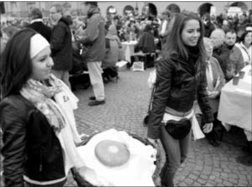
Z ekumenického Kirchentagu