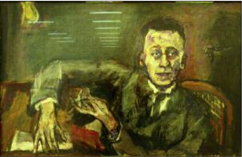
Portrét od Oskara Kokoschky z roku 1925

„Co může být rozhodnuto světovou válkou? Nic kromě toho, že křesťanstvo bylo příliš slabé na to, aby jí zabránilo.“ – Tolik aforismus Karla Krause. Obdobné rozčarování vedlo Masaryka k upřednostnění demokracie před (rakousko-uherskou) „teokracií“ ... Z aforismů rakouského satirika, kritika kultury a recitátora Karla Krause (28.4.1874-12.6.1936) na nás dýchne svět, jehož stopy a ohlasy nacházíme porůznu nejenom v díle Masarykově, ale též u Franze Kafky, Jaroslava Haška, Bohumila Hrabala, Jiřího Menzela, Ludvíka Vaculíka (čtyři posledně jmenované s Krausem pojí téma železnice) ... Krausovské pozoufání z „posledních dnů lidstva“ rozeznávám i za „přelomem v protestantské teologii“, spojeným s dílem Karla Bartha. „Světovou“ rozuměl Kraus tu válku, kterou dnes označujeme jako „první světovou“. (Věcnost, s jakou tak činíme, by mu jistě stála za aforismus.) Na rozdíl od zmizelých či mizejících reálií jako by některé Krausem tepané jevy časem přímo nakynuly ... „Jak se vládne světu a jak se vede válka? Diplomaté obelhávají novináře a věří tomu, když to čtou,“ konstatoval Kraus. Nejslavnější hacker světa zcela nedávno lakonicky konstatoval, že v každé válce bývá první obětí pravda ... „Pokrok slaví Pyrrhovo vítězství nad přírodou,“ hlásil Kraus. Dnešní lidová hláška zní, že druhdy jsme stáli před propastí a od té doby jsme