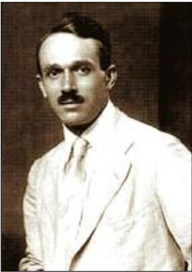
Albín Polášek (14. 2. 1879 – 19. 5. 1965)

Na druhém obrázku muzeum Winter Park - v popředí socha Albína Poláška Rozsévač