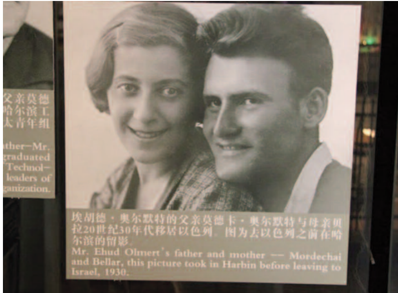
Rodiče Ehuda Olmerta

ně povodeň prolomením přehrady Žluté řeky v naději, že odradí rolníky od dalšího boje. Plán však selhal a místo kýženého výsledku zahynulo okolo 300 000 obyvatel města Kaifeng, které bylo téměř zničeno. Židovská populace se snížila z 5000 zhruba na polovinu. Město, ležící v záplavové oblasti, bylo v historii často sužováno povodněmi, ale tato, uměle vyvolaná, mu zasadila těžkou ránu. Po roce 1642 se kaifengská komunita nikdy plně nevzpamatovala. Zničená synagoga byla sice již poněkoličatě znovu vybudována v roce 1643 a město pomalu ožívalo, ale nastupující mandžuská dynastie Qing měla bohužel poněkud xenofobní politiku. Některá opatření, která měla například zamezit import opia do země, byla zcela pochopitelná, jiná už méně. Mandžuoové se úzkostlivě snažili zachovat si vlastní identitu a zdůrazňovali rasovou čistotu. Zakázali například čínsko-mandžuské sňatky a oblast severního Mandžuska byla zcela uzavřena čínským přistěhovalcům. Lze si snadno odvodit, že Mandžuoové nebyli příliš nakloněni ani menšinám a spory mezi vládou a muslimským a křesťanským obyvatelstvem se vyostřovaly. Židé se sice podobných konfliktů zpravidla neúčastnili, ale mandžuská vláda rozdíl ignorovala, a tak začali Židé svou identitu raději skrývat. Dynastie Qing se uzavřela vůči všemu „cizímu“ jak zvenku, tak i zevnitř a tím ovšem zároveň isolovala čínské židovstvo od zbytku světa. Ani čínské židovské komuni-