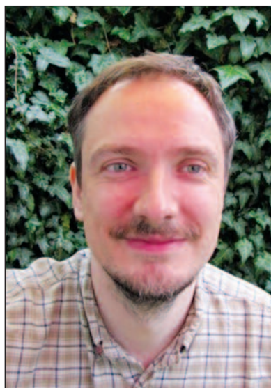
DOBŘE ROZLOUČENÍ JAN 14,23-27

Někdo, koho máte rádi, odjíždí na delší dobu pryč. Už dopředu víte, že se vám bude stýskat. Jak bude vaše loučení vypadat? Určitě si slíbíte, že