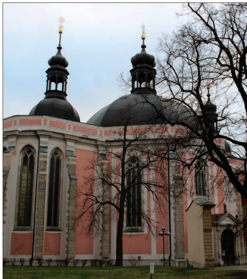
Letošní novoroční ekumenická slavnost se konala v Praze na Karlově