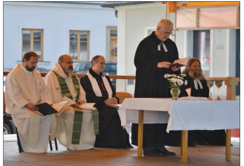
Svátek mistra Jana Husa oslavili na desítkách míst bohoslužbou - někde, např. v Litomyšli, v ekumenickém duchu i za účasti Římskokatolické církve