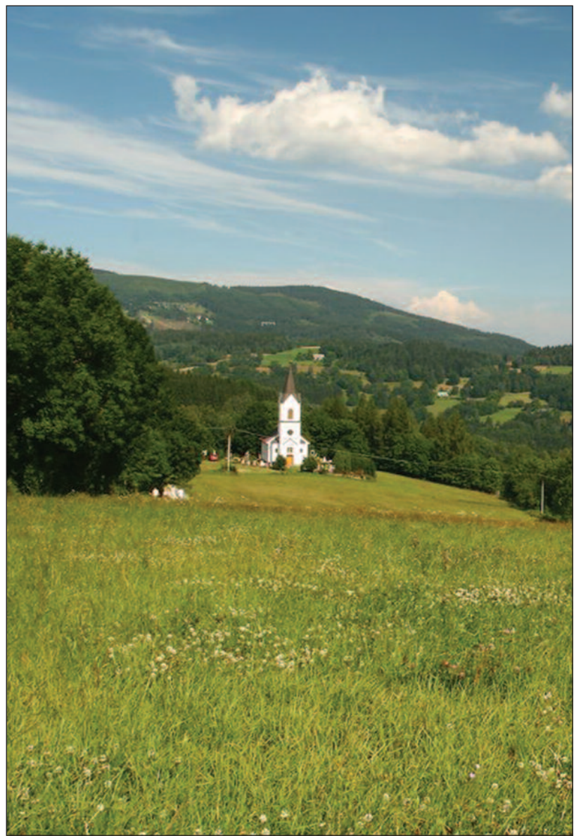
Evangelický kostel Křfzlice - Tichý svědek věrnosti (viz str. 2)