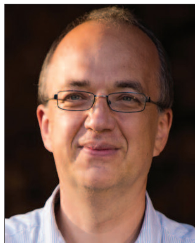
VYVOLENÍ KE ZVĚSTOVÁNÍ BOŽÍHO EVANGELIA ŘÍMANŮM 1,1-7

O tom, že byl apoštol Pavel vyvolený ke zvěstování evangelia, o tom asi nemáme pochybnosti. O ovoci jeho služby velmi dobře věděli i ve sboru v Římě, přestože Pavel zatím Řím ještě nenavštívil. Dlouho zvažovanou cestu do Říma dosud odkládal kvůli misii v oblastech zatím nezasažených evangeliem (Ř 15,23). Nyní pro sebe nevidí východně od