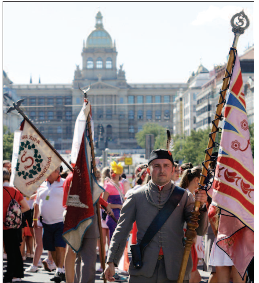
XVI. všesokolský slet ke 100. výročí vzniku republiky