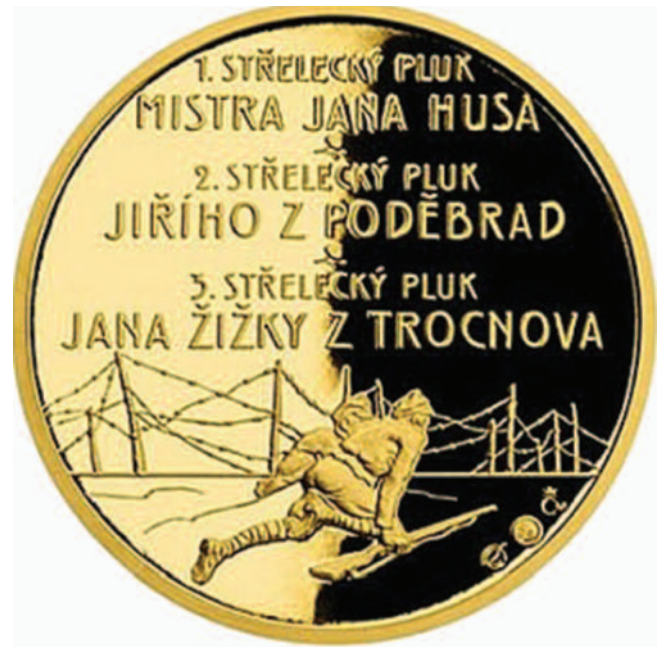
Zlatá pamětní medaile - upomínka na bitvu u Zborova

V době nacistické okupace velká úcta k Masarykovi posilovala národ v úsilí o obnovu svobody, a to jak politickou a vojenskou činností v zahraničí, tak zesilujícím odbojem domácím. Demokracie však u nás trvala po druhé světové válce jen dva a půl roku. Po únorovém puči KSČ r. 1948 začal být TGM zamlčován ve školách a pokračovala snaha o jeho oficiální diskreditaci. Stoupenci jeho zásad byli zavíráni či dokonce popravováni. Skutečně se podařilo v části obyvatelstva a zejména mladé generace Masarykův obraz znehodnotit nebo alespoň zamlčet. Tento odkaz bylo možno dále předávat pouze v okruhu rodiny nebo přátel. Velký význam měla i různá ilegální společenská setkávání a aktivity, které často působily pod zástěrkou legálních společenských organizací (Sokol, Klub českých turistů aj.). Pokus o myšlenkové uvolnění v „pražském jaru“ 1968 byl