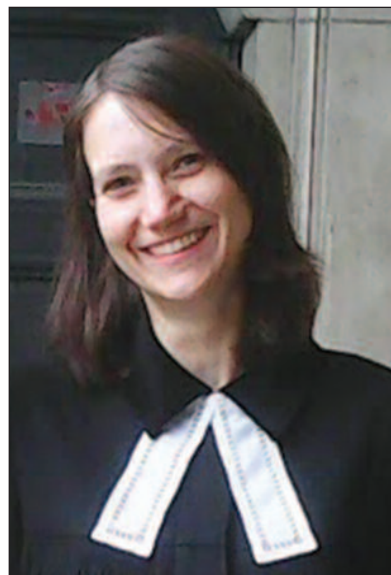
VÝKŘIK V NOUZI IZAJÁŠ 38,14

Panovníku, jsem v tísní, zasaď se o mne!