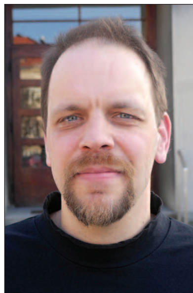
EVERGREEN BOŽÍHO MILOSRDENSTVÍ Ž 89,29

Kdo poslouchá rádio, ví, jak to chodí s novými písničkami. Když píšete slyšíte poprvé, chytne vás rytmem, melodií nebo vtipným obratem v textu. Napodruhé a napopáté si při ní podupáváte a po-brukujete. Ale po měsíci pravidel-ného uvádění se vám zpravidla ne-