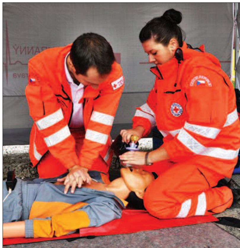
Český červený kříž se dnes mj. podílí na vzdělávání mládeže i dospělých v oblasti poskytování účinné první pomoci.