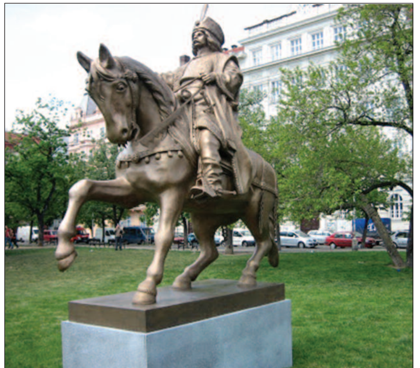
Dočasný pomník husitského krále na náměstí Jiřího z Poděbrad vydržel v roce 2014 jen pár dní. Maketu nechalo pro Prahu vyrobit město Poděbrady.