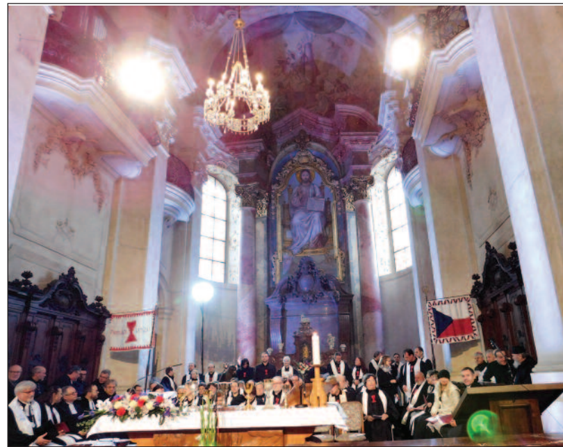
Z úvodní bohoslužby v chrámu sv. Mikuláše