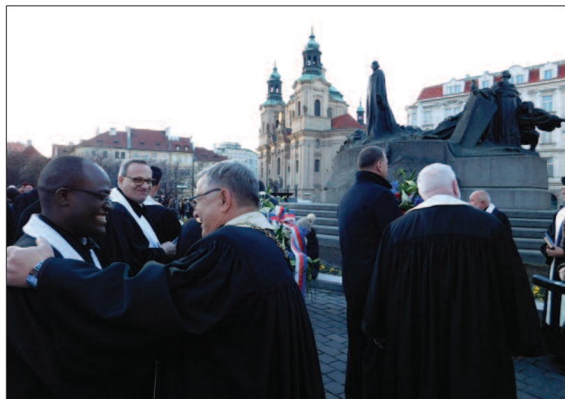
Položení květin k pomníku Jana Husa