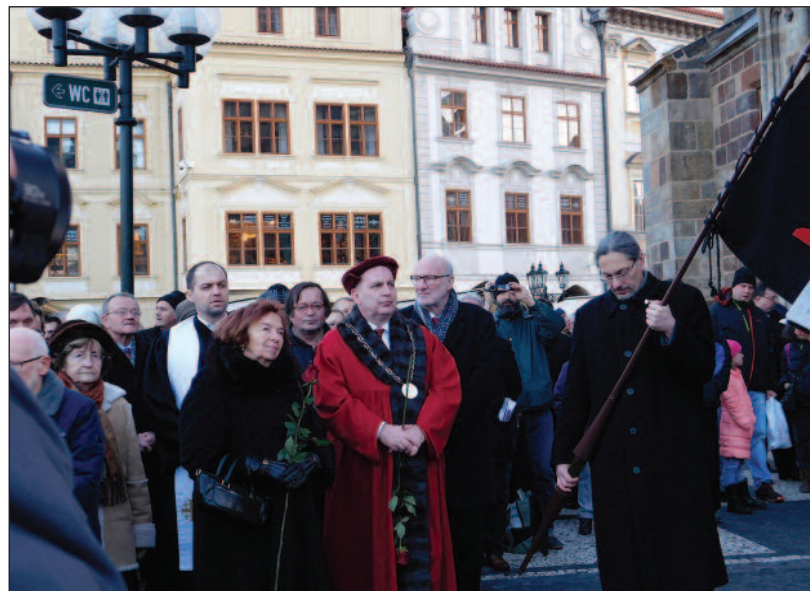
Položení květin u pamětní desky na Staroměstské radnici.