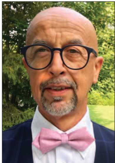
BÁZEŇ PŘED BOHEM GENESIS 39,9

V rámci výuky aplikované etiky na půdě jedné univerzity jsem se studenty diskutoval o podvodech, korupci a neférových výhodách „mocných“, které v dnešní době „letí“. Když došlo na písemky, testy a zkoušky, jedna studentka řekla: „Já, když mohu a nikomu tím neublížím, tak podvedu.“ Hlasování v oné padesáticenné skupině ukázalo, že lež, podvod a korupci považovalo téměř 70 % přítomných za přirozenou součást dnešního života. Navíc