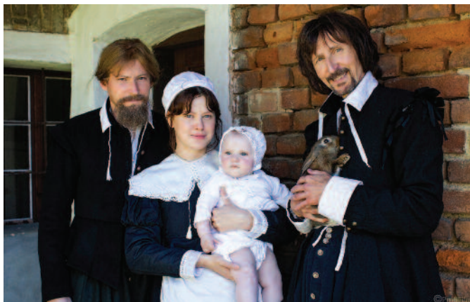
Foto z připravovaného filmu Jako letní sníh