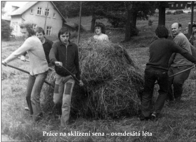
Práce na sklízení sena – osmdesátá léta

Spíše sezonní využití objektu by mohlo církvi také sloužit podobně jako domek na Blažkově a v zimě by se v první fázi obnovy topilo jen lokálně, což je jistě lepší, než když chalupa ležela tak dlouho ladem. Ani v druhé fázi s centrálním topením, jsme neuvažovali vytápět celý objekt a kamennou část nebo chodby plánovali ponechat pro expozici lidové architektury i působení církve v lokalitě a jako technické či hospodářské zázemí. Návaznost na tradice místa může atraktivitu Horského domova jako turistického cíle zvýšit. Záměrem synodní rady je pronajmout budovu k ubytování v rámci Horského domova jako ostatní objekty pod správou nového schopného nájemce. (Tím nechci říct, že