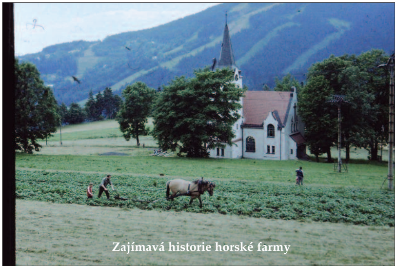
Zajímavá historie horské farmy